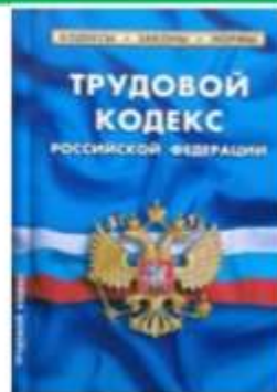
Раздел III ТК РФ