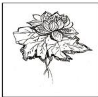
Рисунок 5 – Графический цветок

3.7.5 Все изображения в приложениях следует именовать словом Рисунок и нумеровать арабскими цифрами сквозной нумерацией, начавшейся в тексте, если туда были помещены иллюстрации. На все рисунки в тексте пояснительной записки должны быть даны ссылки. В одном приложении могут быть расположены один или несколько рисунков. Например: