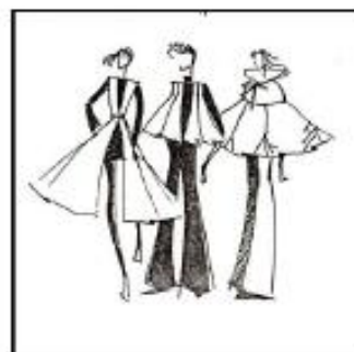
Рисунок 6 – Эскизы костюмов