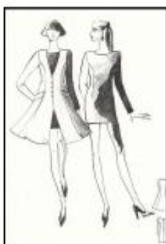
Рисунок 7 – Эскизы платьев